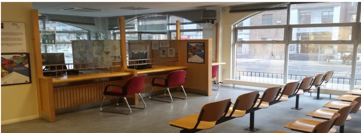
(Esika ya bozeli mpo na masolo ya Interview)

To sengi nayo o serappeler nto okanisa mpo na kopesa biyano na mituna nyonso mpe na bosolo nyonso mpo ete to koka kozala naba information nyonso oyo esengeli epayi na biso moko awa.