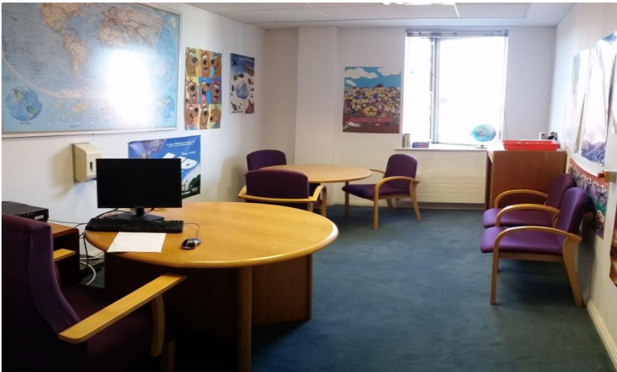
(Sale ya Interview ya monene)

Groupe moko ya bato oyo bazali na experience ya kosalisa interview na kati ya Bureau ya Potection Internationale esili kozua mpe kobakisa formation ya special mosusu mpo ete ekoka kosalisa bango bakoka ko tala ba cas oyo etali basengi ya mikandaoyo bazali mpe kaka lokola yo (ba mineurs oyo bazali na ba mikolo pembeni te/bana oyo bazali separé).Moto oyo akosalisa interview akozala specialement formé mpo na ko koka kosala interview na bana oyo mbula na bango ezali na nse ya 18 ans.