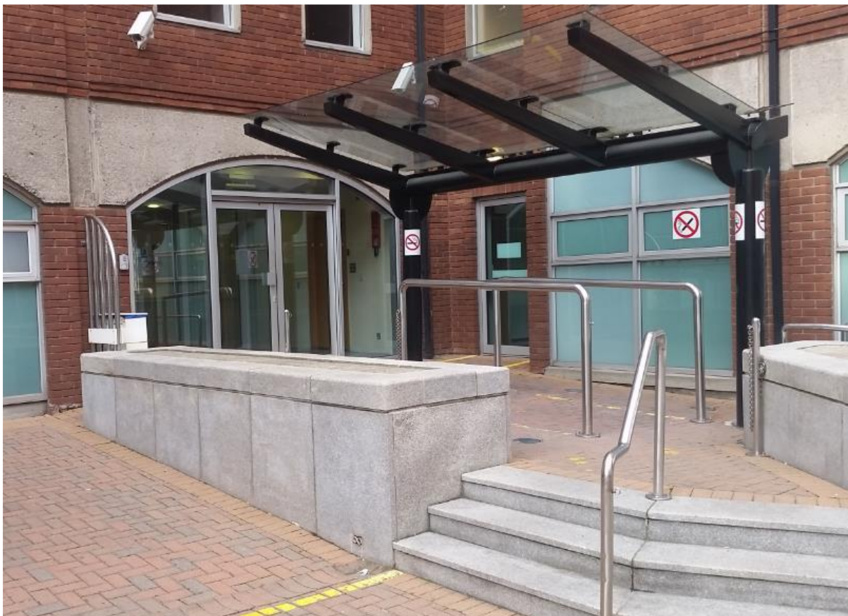
(Ezibeli ya ko kota na Réception)

Interprete akolimbola makambo oyo okoloba mpo ete yo na mosali nto mpe agent oyo ya kati ya Bureau ya Protection Internationale bokoka koyokana na kati ya kosolola. Interprete akoki koloba Anglais mpe na monoko mosusu oyo yo ozali kolobaka. Interprete akovandaka ntango inso na kati ya salle moko na yo. Na nzela ya interprete yo na membre ya reception bokoki kosolola elongi na elongi. Interprete akolimbola kaka makambo oyo elobami. Interprete azali na makoki ya kolobela makambo nayo to mpe ba detailsna yo epayi ya moto mususu te, na lolenge wana okoki koloba histoire na yo na kati ya kimia mpe securité nyonso.