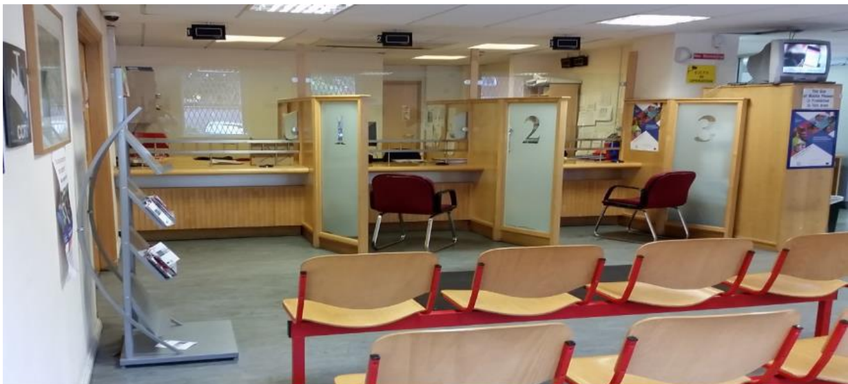
(Reception ya Monene)

Na kati ya interview nayo liboso bakotala lisusu soki Bureau ya Protection Internationale ekoki ko consider dossier nayo ya kosenga mikanda, procedure oyo eyebani lokola processus ya admissibilité oyo elingi kososola soki bakondima kotala dossier na yo nto mpe te.